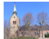
Pfarrgarten Nordgermersleben Hauptstraße 34 39343 Hohe Börde