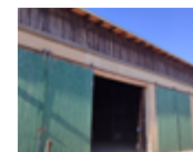
Feldscheune Hundisburg (Familie Prüße) Bahnhofstraße 14 39343 Hundisburg