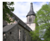
Sankt Andreaskirche, Hundisburg Kirchstraße 1 39343 Hundisburg