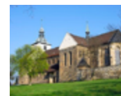
Kloster St. Marienberg Klosterstr. 14 38350 Helmstedt