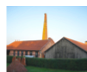
Technisches Denkmal Ziegelei, Hundisburg Jacob-Bührer-Straße 2 39343 Hundisburg