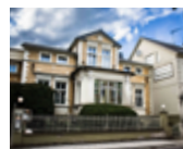
Hotel & Restaurant Behrens Bahnhofstraße 28–30 39340 Haldensleben