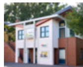
Haus »Aquarell«, Haldensleben Hagenstraße 60 a 39340 Haldensleben