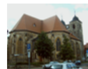
Nicolaikirche, Oschersleben Kirchplatz 39387 Oschersleben (Bode)