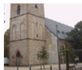
Marienkirche, Haldensleben Magdeburger Str. 9 39340 Haldensleben